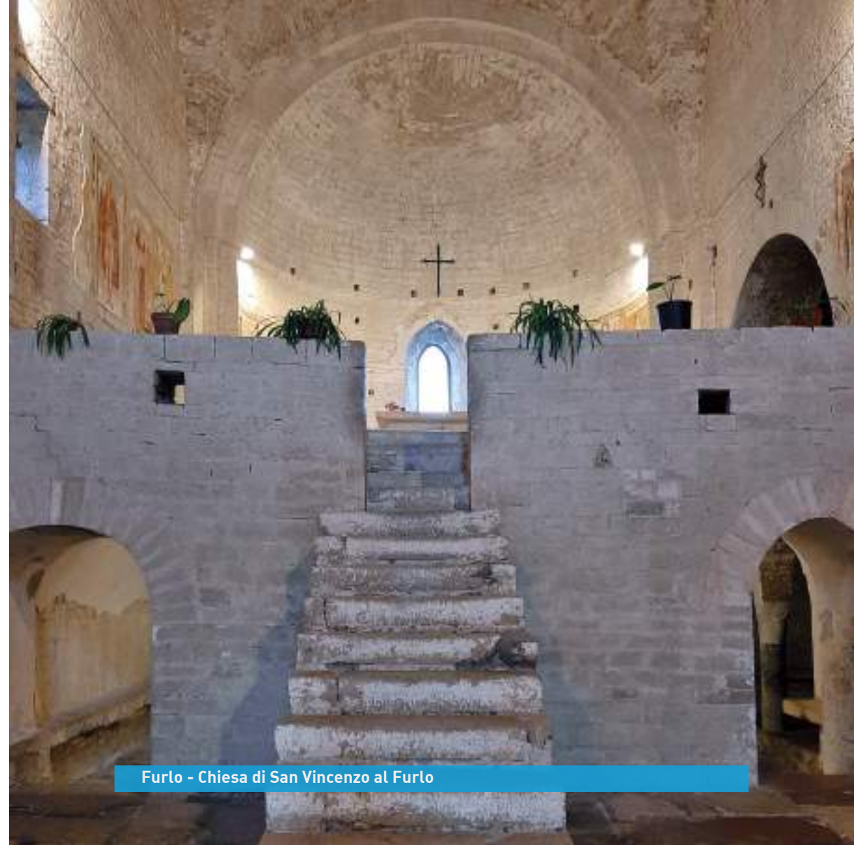
Furlo - Chiesa di San Vincenzo al Furlo

Pranzo organizzato in corso di escursione, cena libera.