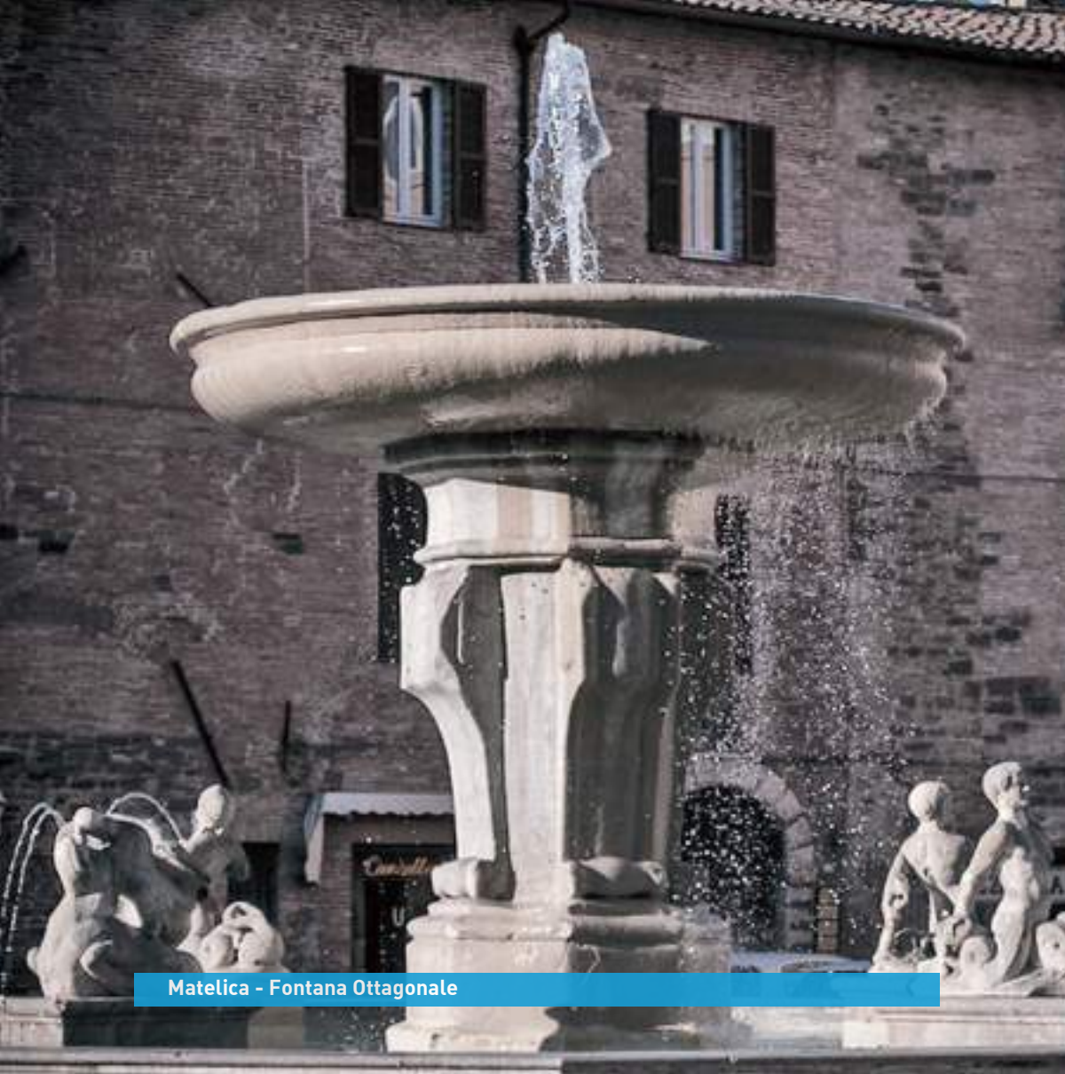
Matelica - Fontana Ottagonale