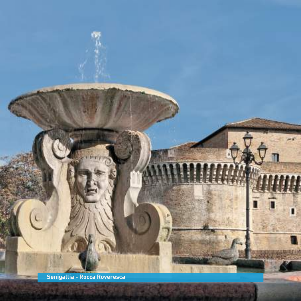
Senigallia - Rocca Roveresca