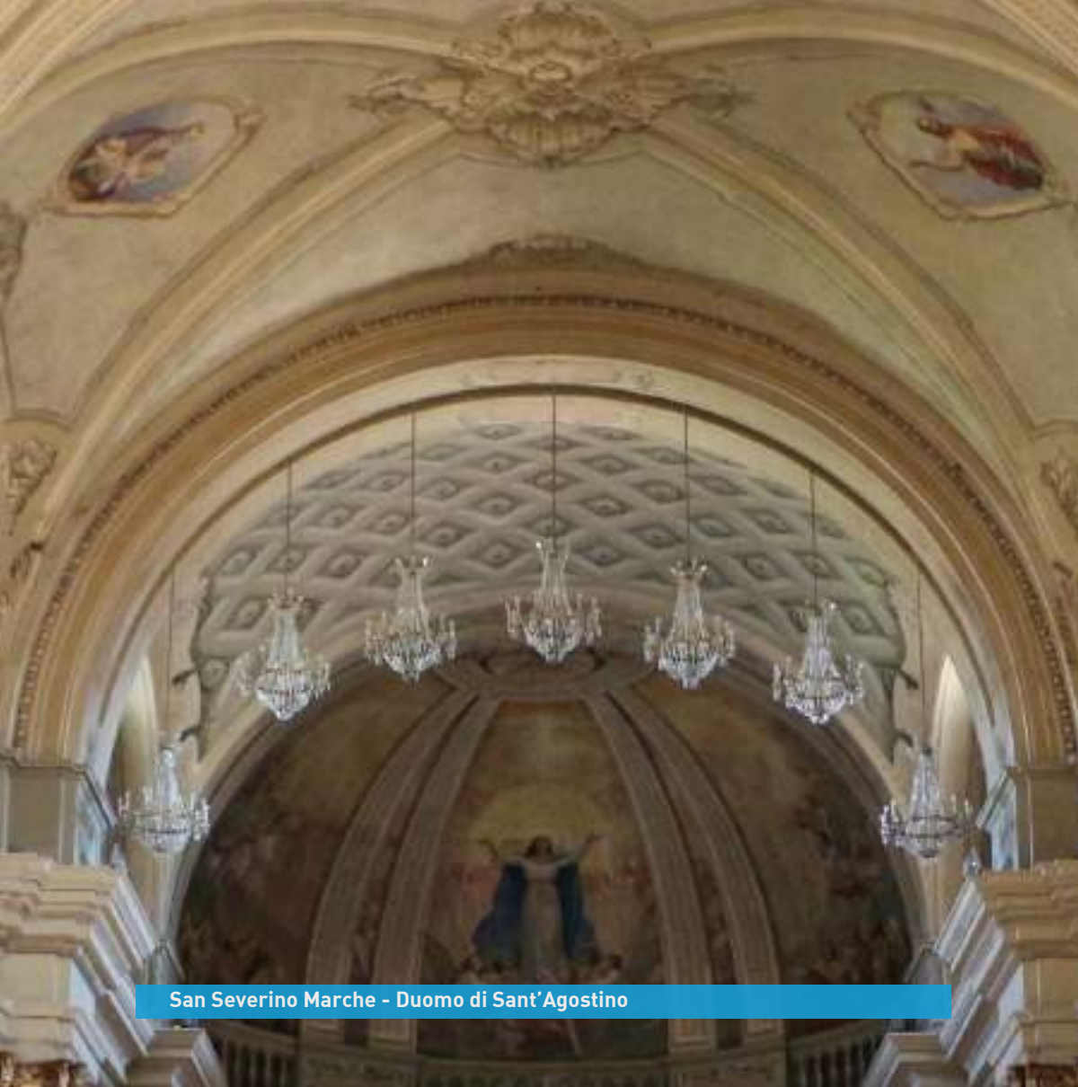
San Severino Marche - Duomo di Sant'Agostino