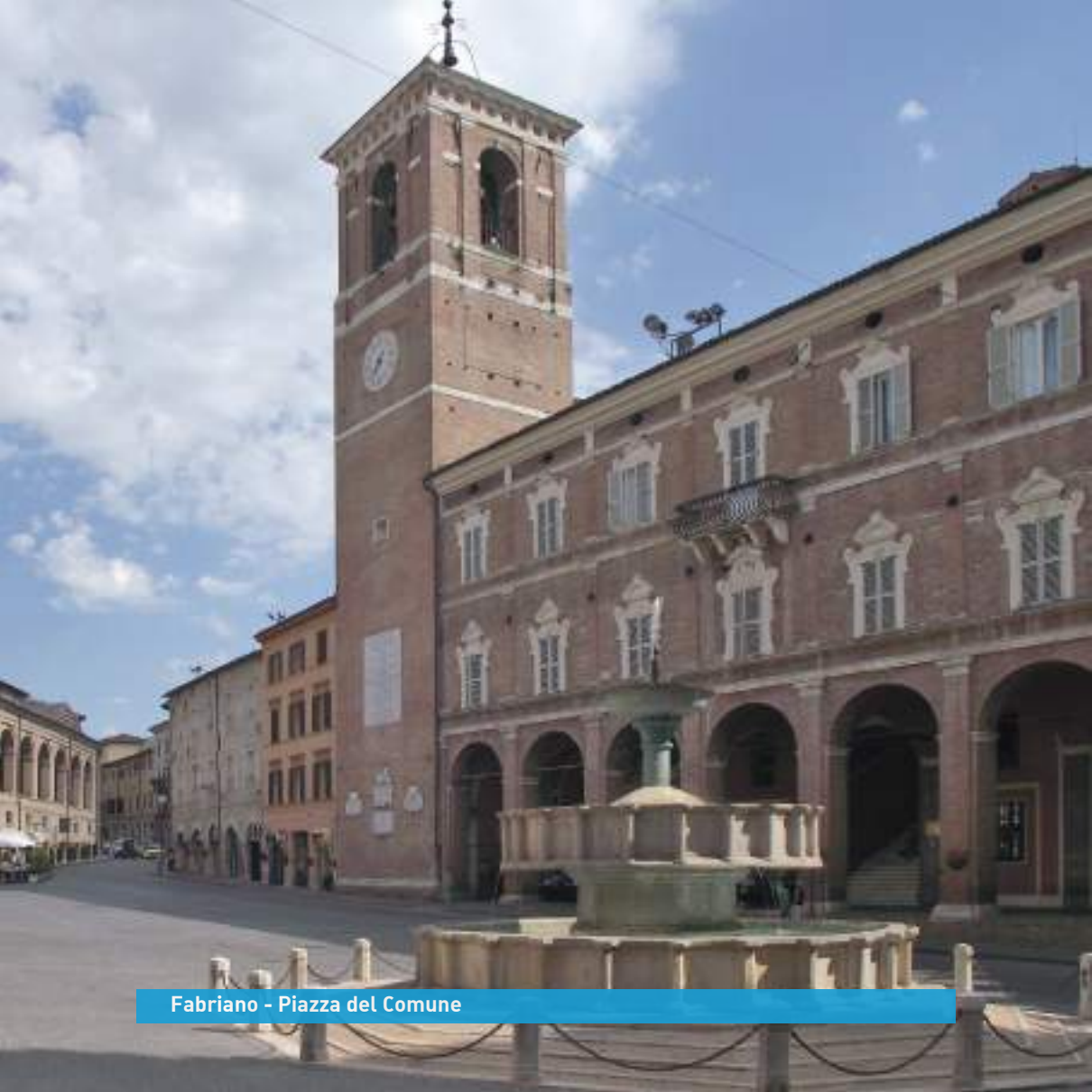
Fabriano - Piazza del Comune